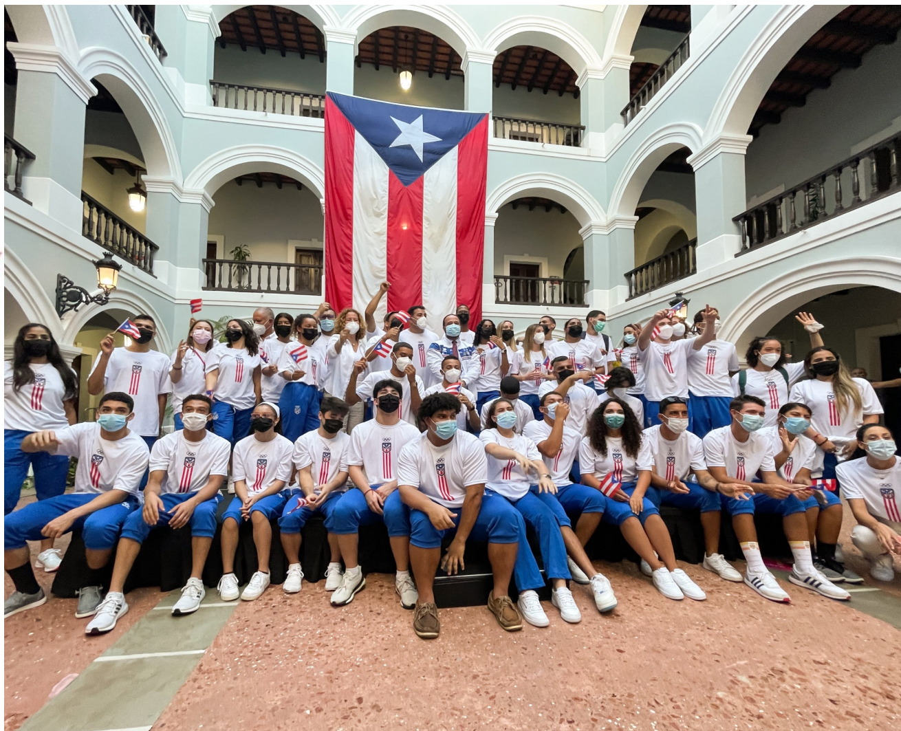
La Delegación de Puerto Rico está integrada por 158 deportistas.