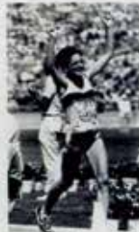
Portugal CTT N20grs