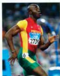
Portugal CTT N20grs