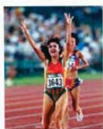
Portugal CTT N20grs