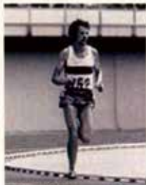
Portugal CTT N20grs