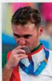
Portugal CTT N20grs