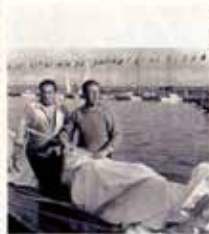
Portugal CTT N20grs