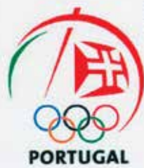
Portugal CTT N20grs