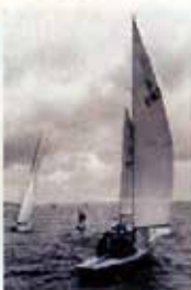
Portugal CTT N20grs