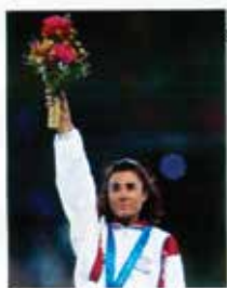
Portugal CTT N20grs