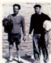
Portugal CTT N20grs