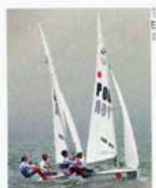
Portugal CTT N20grs