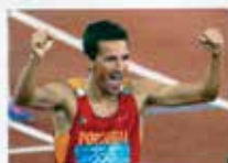
Portugal CTT N20grs