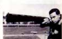
Portugal CTT N20grs