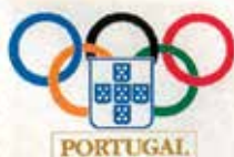
Portugal CTT N20grs