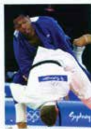
Portugal CTT N20grs