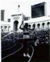
Portugal CTT N20grs