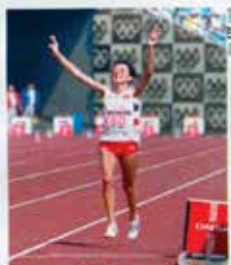
Portugal CTT N20grs